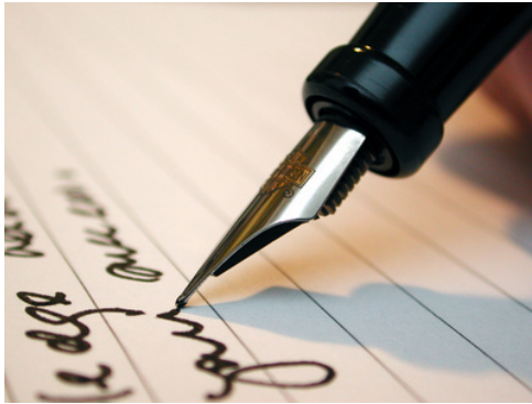
CV et lettre de motivation

Pour quels concours ces documents sont-ils exigés ?